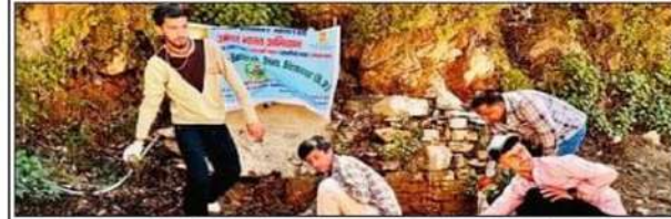
जलस्रोतों की सफाई करते संगड़ाह कॉलेज के विद्यार्थी।